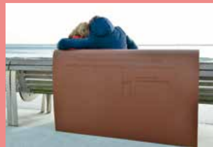
Les bancs sont installés face à la résidence du Traict, près du jardin des plantes et à Sautron.