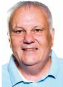
Thierry NOGUET Gestion et valorisation des déchets Maire de Montoir-de-Bretagne