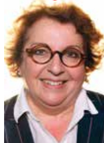
Catherine LUNGART Aménagement durable Maire de Saint-André-des-eaux