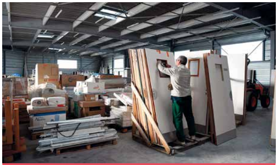
L'ancien laboratoire pharmaceutique acquis par Emmaüs Saint-Nazaire dans la zone de Brais subit des transformations pour ouvrir de grands espaces de vente au public, fin février.

3,3 millions d'euros ont été investis dans cet ancien laboratoire pharmaceutique construit en 1996 et occupé pendant une dizaine d'années. Emmaüs parvient à assumer cet enga-