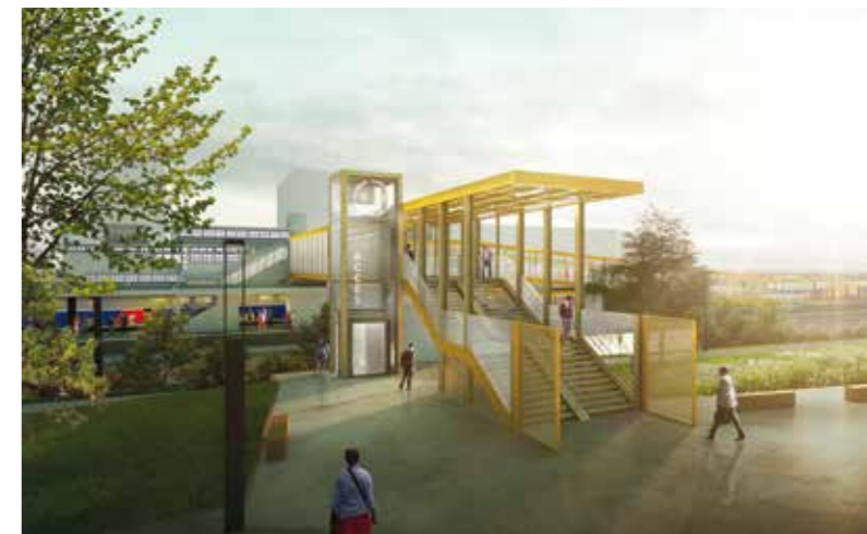
Accès Nord de la gare de Saint-Nazaire.