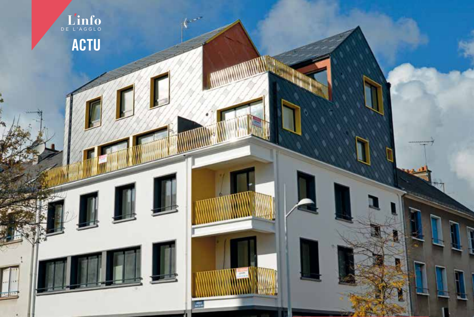
Démarré en octobre 2016, le chantier s'est achevé à la fin de l'année 2017.