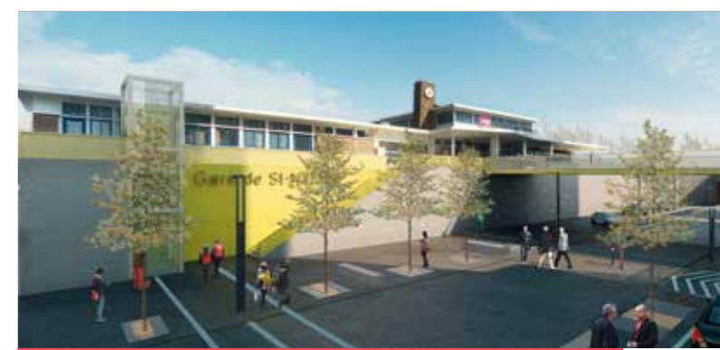
Entrée Sud de la gare. ©SEURA-STN

nouveau "quartier" autour de la gare TGV rénovée », déclare le maire de Saint-Nazaire David Samzun.