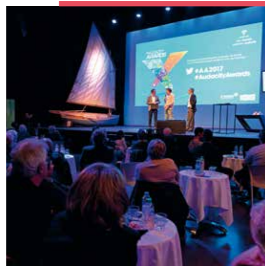
L'association Le MarSoins a remporté le Prix du public dans la catégorie Défi innovation sociale et RSE.

Les six lauréats de ce cru 2017 des Audacity Awards portent à 35 le nombre d'initiatives récompensées et soutenues depuis la création du concours. Chacun est reparti avec un chèque de 2000 euros, des entrées à des salons professionnels et la promesse d'un accompagnement par des professionnels aguerris. Trois jeunes créateurs se sont également vu attribuer un coaching Starter d'un an.