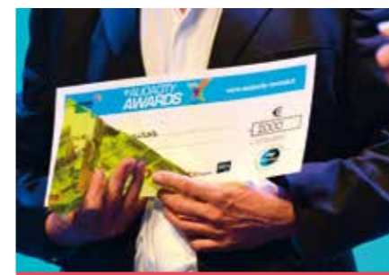
Chaque lauréat a reçu un chèque de 2000 euros.

+ ATTRIBUTION D'UN COACHING STARTER D'UN AN