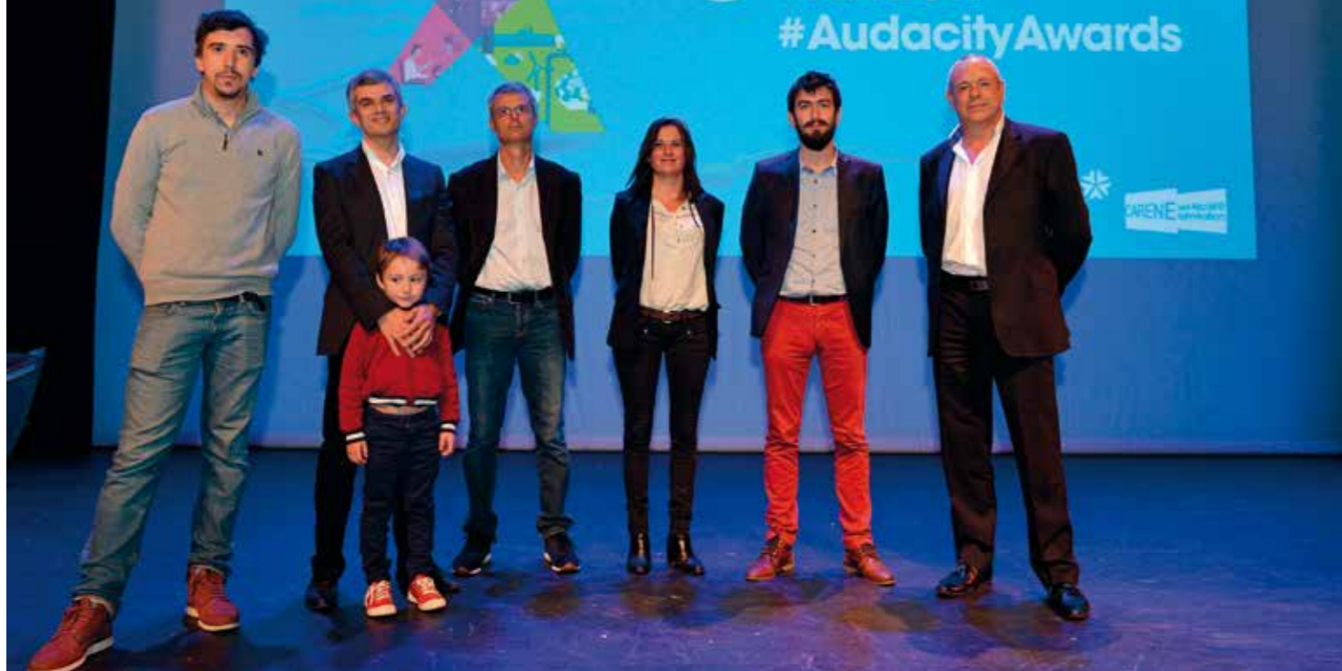
Les six lauréats de la sixième édition des Audacity Awards 2017.