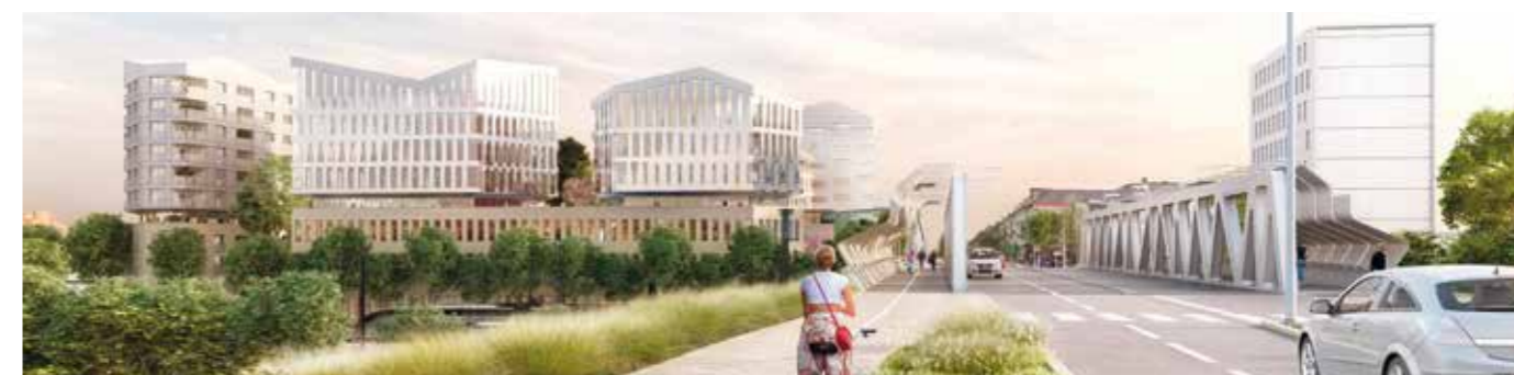
Entrée de ville : projet Linkcity vu du pont de la Matte © TOLIA+GILLILLAND POUR LINKCITY

L'architecture retenue pour ce nouveau projet immobilier est celle proposée par le promoteur Linkcity. À proximité de la gare SNCF de Saint-Nazaire, à la place de l'ancienne station-service, plus de 5 000 m 2 de bureaux, 40 logements libres, un hôtel de 110 chambres 2* et 3* et des commerces vont voir le jour. « Nous allons réaliser une opération immobilière importante, un