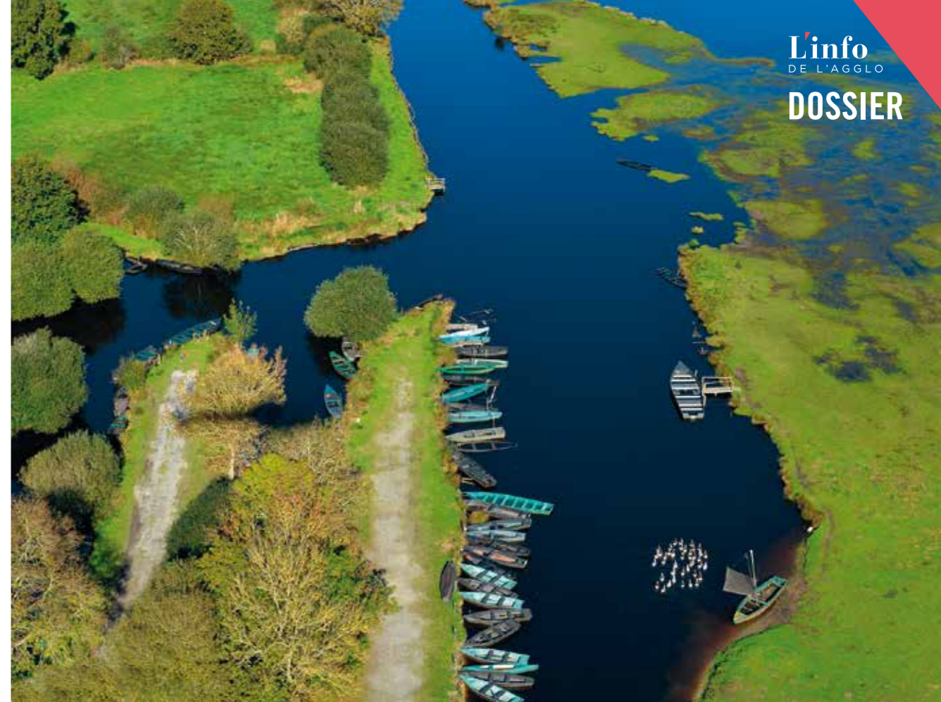
Le Parc Naturel Régional de Brière va désormais pouvoir se recentrer sur ses vocations premières : conservation des milieux, valorisation des ressources locales, sensibilisation à l'environnement et animation touristique.